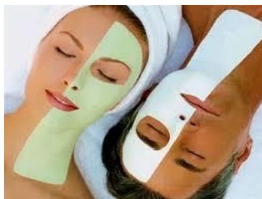
Assistente de Beleza